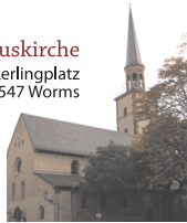
Ev. Magnuskirche Weckerlingplatz 67547 Worms