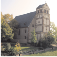
Ev. Bergkirche Pfarrer-Jobst-Bodensohn-Str. 7 67549 Worms-Hochheim