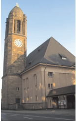
Ev. Lutherkirche Karlsplatz 67549 Worms