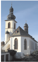
Kath. Kirche Maria Himmelskron Pfarrer-Johannes-W.-Weil-Str. 6 67549 Worms-Hochheim