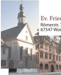
Ev. Friedrichskirche und Rotes Haus Römerstr. 76 67547 Worms