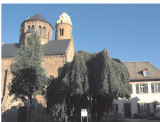
Kath. Kirche St. Paulus mit Dominikanerkloster Paulusplatz 5 67547 Worms